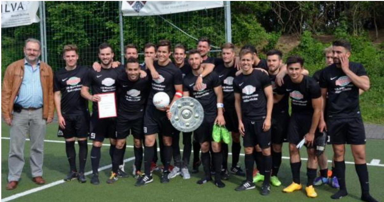
Macht sich gut, die Meisterschale in den Händen der Spieler der DJK Flörsheim.

Der große Favorit holte sich souverän den Titel in der Fußball-Kreisoberliga Main-Taunus.