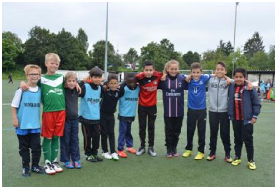
Ihre Eltern kommen aus dem Senegal, Nigeria, Polen, Serbien, Italien und Frankreich: Für die jungen Sportler in der DJK ist „multikulti“ selbstverständlich..