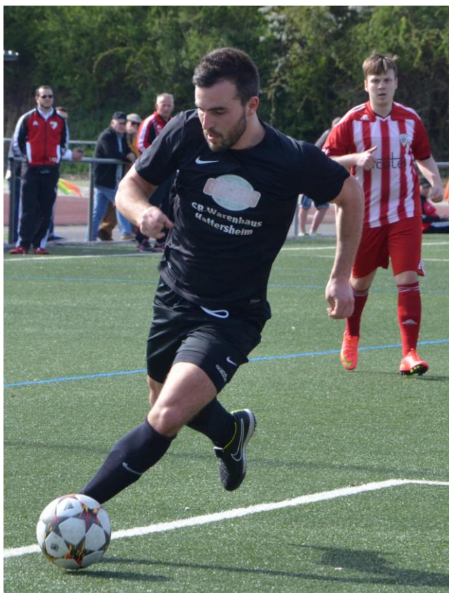
Oft blieb dem Gegner nur der Blick hinterher