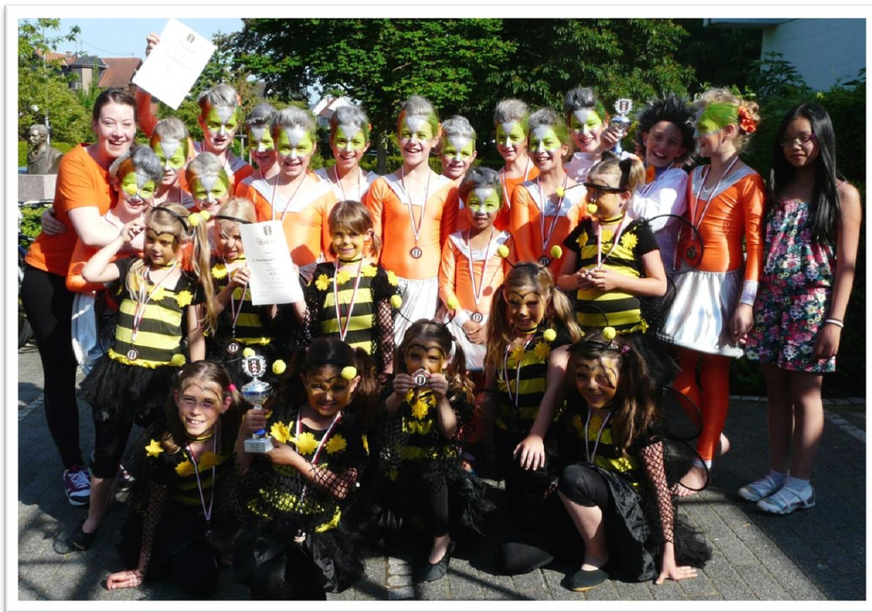
Die Showturngruppen Mapindus und Pamoja nach dem Doppelsieg in Harheim